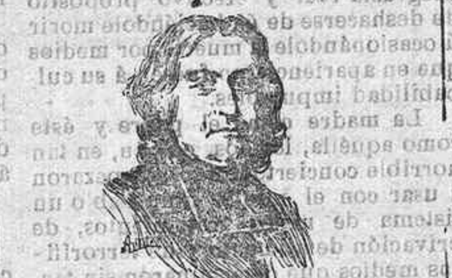
EL CARDENAL FLEURY

El diablo me lleve si este postillón no está borracho... La marquesa impuso silencio con gesto y dejó caer la cabeza entre sus manos.