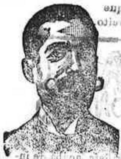
Angelo Costanzi Dip., 345, Barcelona

Preparación la más racional para curar la tuberculosis, catarros crónicos, bronquitis, infecciones graves, enfermedades crónicas, impotencia, debilidad general, postración nerviosa, neurastenia, impotencia, enfermedades mentales, caries, raquitismo, esgorriamiento, etc. Frasco, 2'50 pesetas. DEPOSITO: Farmacia del Dr. Benedicto, San Bernardo, 41, Madrid y en la provincia de Salamanca, Farmacia del Dr. Redilla, Gutiérrez.