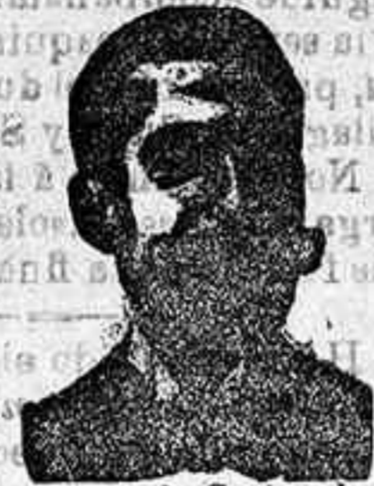
Angelo Costanzi Dip. 435, Barcelona

Especialidad en bombones de chocolate con crema, finísimos caramelos suizos lindos y dulces varios. De venta en todas las confiterías.—Depósito central, MONTERA, 25.—MADRID