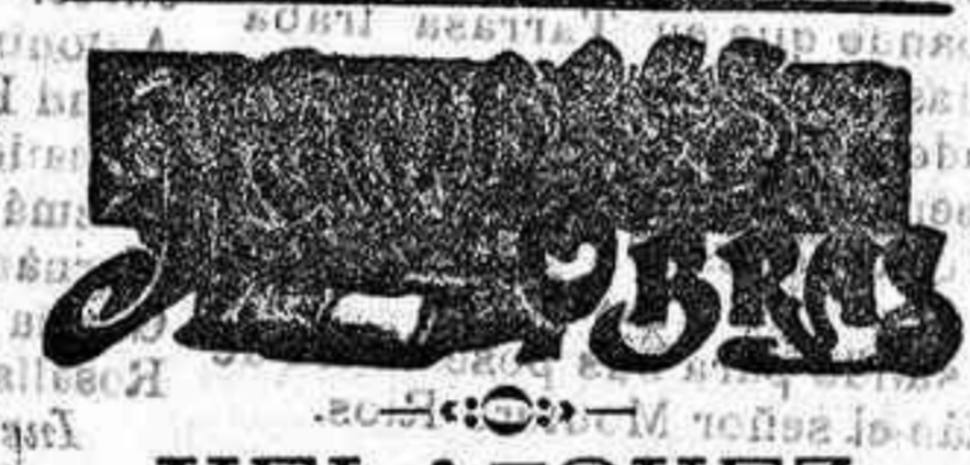
VELAZQUEZ 6 de Junio