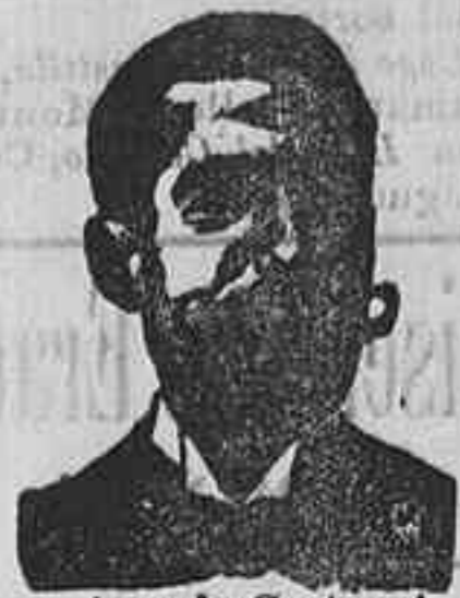
Angelo Costanzi Dip., 345, Barcelona

Preparación la más acionada para curar la tuberculosis, catarros crónicos, bronquitis infecciosas, gripales, enfermedades consuntivas, insipiente, debilidad general, postración, nervios, neurastenia, impotencia, enfermedades mentales, caries, raquitismo, escrofulismo etc. Frasco 2'50 pesetas. DEPOSITO: Farmacia del Dr. Benedicto, San Bernardo 41, Madrid y en la provincia Salamanca, de farmacia del Lledo, Rodilla, Guijuelo.