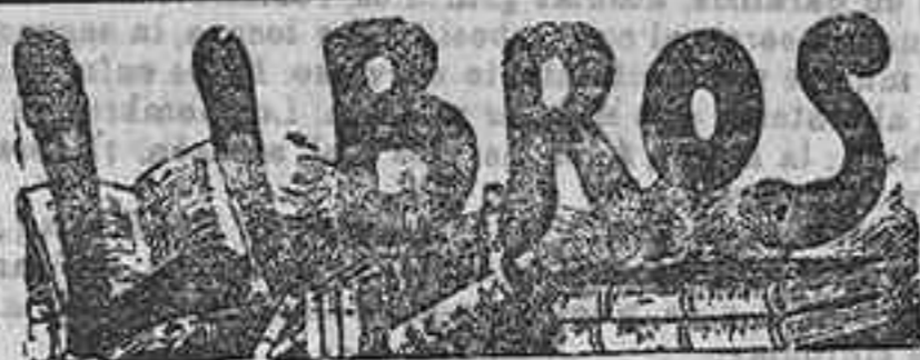
Otro de Tolstoy

Para facilitar bagaj a fin de trasladarse a diferentes localidades se extendieron 904 certificados de enfermedad, que utilizaron 1.596 menesterosos.