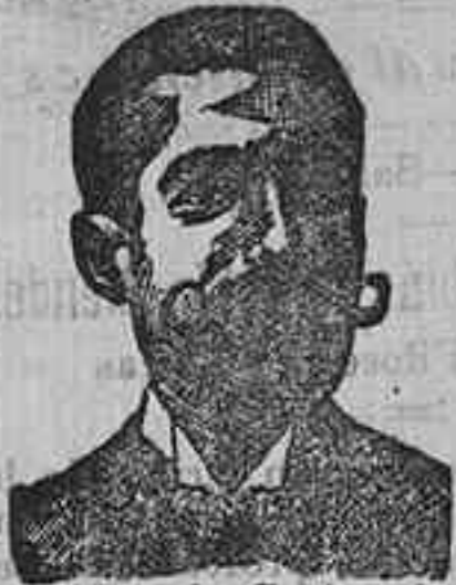
Angelo Costanzi Dip., 345, Barcelona

Preparación la más acionada para curar la tuberculosis, catarros crónicos bronquitis infecciones gripales, enfermedades consuntivas, inanancia, debilidad general, postración, nerviosa neurastenia, impotencia, enfermedades mentales, caries, raquitismo, escrofulismo etc. Frasco 2'50 pesetas. DEPÓSITO: Farmacia del Dr. Benedicto, San Bernardo 41, Madrid y en la provincia Salamanca, de farmacia del Licdo. Rodilla. - Guijuelo.