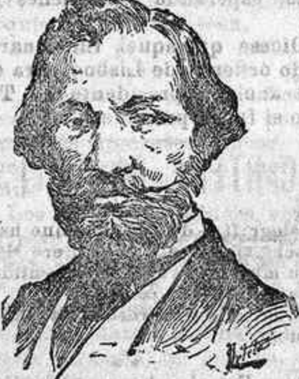
A fable, sencillo, de conversación amena y encantadora, gran admirador de la pintura y del arte dramático y entusiasta de su patria no obstante conocer y haber vivido mucho tiempo en París, rebosaba satisfacción