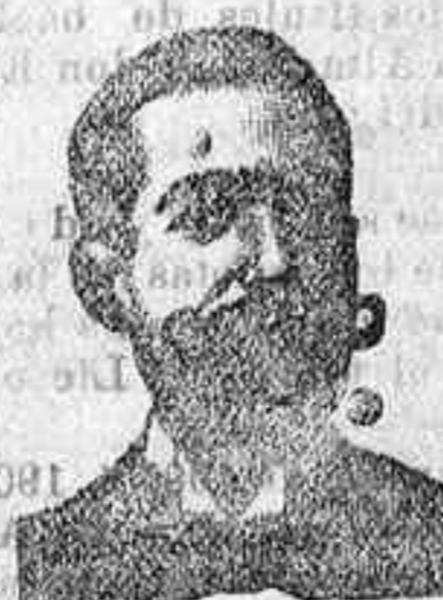
SAVITICOSTZI Diputación, 435, Barcel.