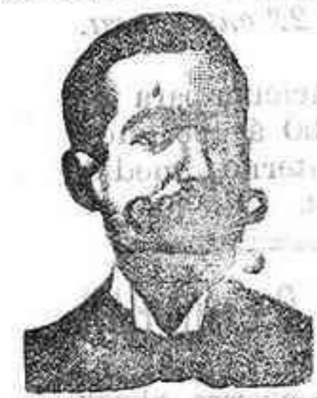
SALV. COSTANZI Diputación, 435, Barcel.

Ladrillos prensados, tejas, tubería, baldosas, bloques y pavimento s. Azulejos de Mantas é ingleses y macetas para jar tineras y salón.