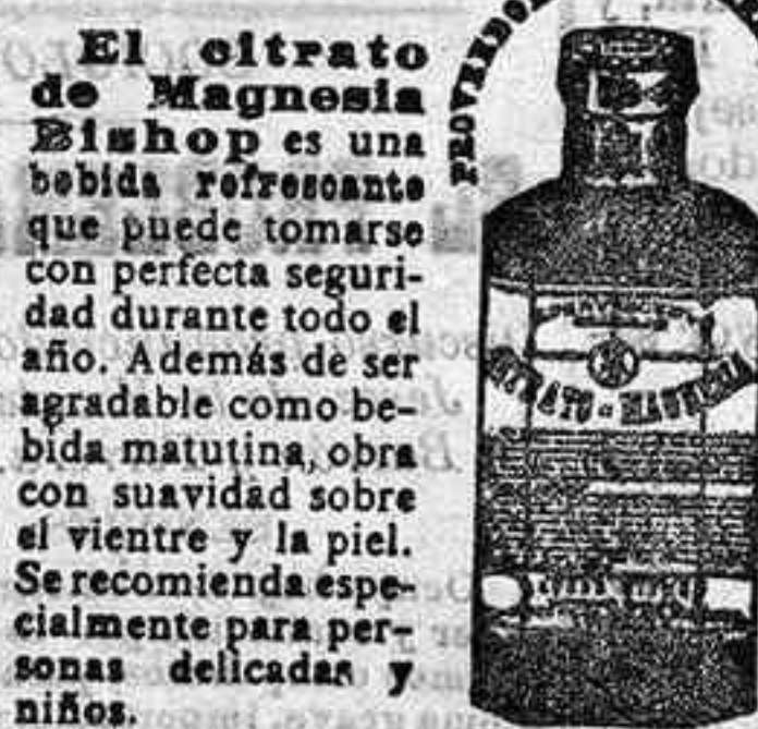
MAGNESIA DE BISHOP.

El citrato de Magnesia Bishop es una bebida refrescante que puede tomarse con perfecta seguridad durante todo el año. Además de ser agradable como bebida matutina, obra con suavidad sobre el vientre y la piel. Se recomienda especialmente para personas delicadas y niños. De venta: En todas las Farmacias y Droguerías.