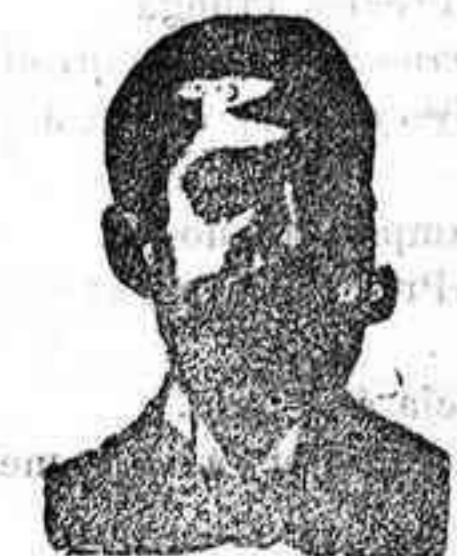
Inventor de los renombrados medicamentos COSTANZI , Dip. 435, Barcelona

Roob antisifilítico Inyección vegetal COSTANZI