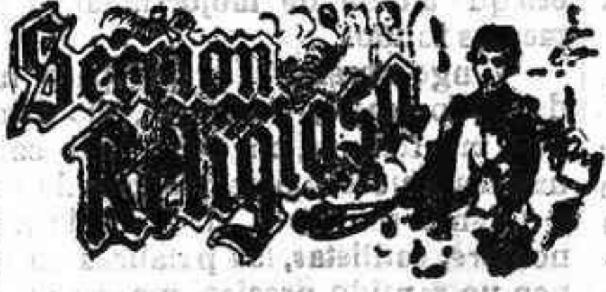
Mañana: San Deñe obispo.