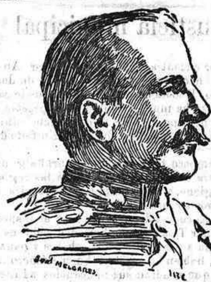
Como nota gráfica de la catástrofe del «Berlín», publicamos el retrato de una de las víctimas: Sir Arturo Herbert, correo di- plomático del rey de Inglaterra, que ha encontrado la muerte en el naufragio.

Allá hubo un muerto, y de cierto quien lo mató no se sabe; de lo que duda no cabe es de que el muerto está muerto.