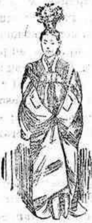
Dama noble de Corea

Como se ve, la mujer entre los que, como los coreanos, profesan la religión budhista, es tan despreciada como entre los islamitas, por cuanto al feminismo que tanto terreno abonan las razas civilizadas no adelanta un paso cerca de las que no lo son.