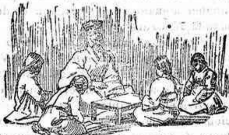
Una escuela en Seul

Respecto a instrucción pública, pocas noticias nos suministran los datos que tenemos a la vista. Parece que no se carece de escuelas, y que en ellas se enseña el racionalismo de Confucio, al cual rinden fervoroso culto, los letrados del país.