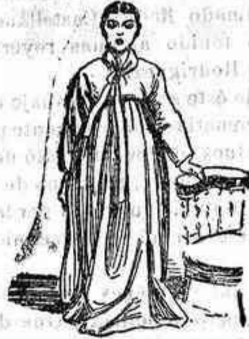
Coreana en traje de visita

La población de Corea, estacionada en la primera etapa del camino de la civilización, se divide en tres castas, que son los nobles, el pueblo y los siervos.