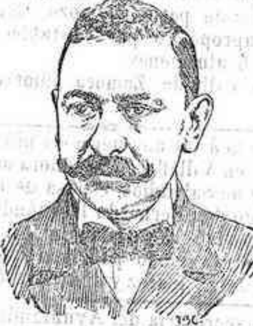
Sr. García Prieto Ministro de Fomento