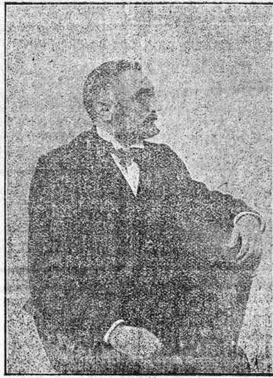
Don Miguel de Unamuno

Esta escuela en efecto no pide privilegio gratuito alguno, ni fundado en cosas pasadas, pues sabe que pasó afortunadamente el tiempo de ellos. Solo pide la protección al presente indispensable para que pueda prosperar en ella la obra de la alta cultura patria, pues sin el apoyo del Estado que V. M. representa, sin ese apoyo, como garantía de la libertad de la ciencia percería hoy está al libre concurso de los elementos populares.