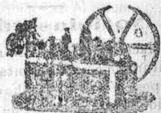
Máquina de vapor