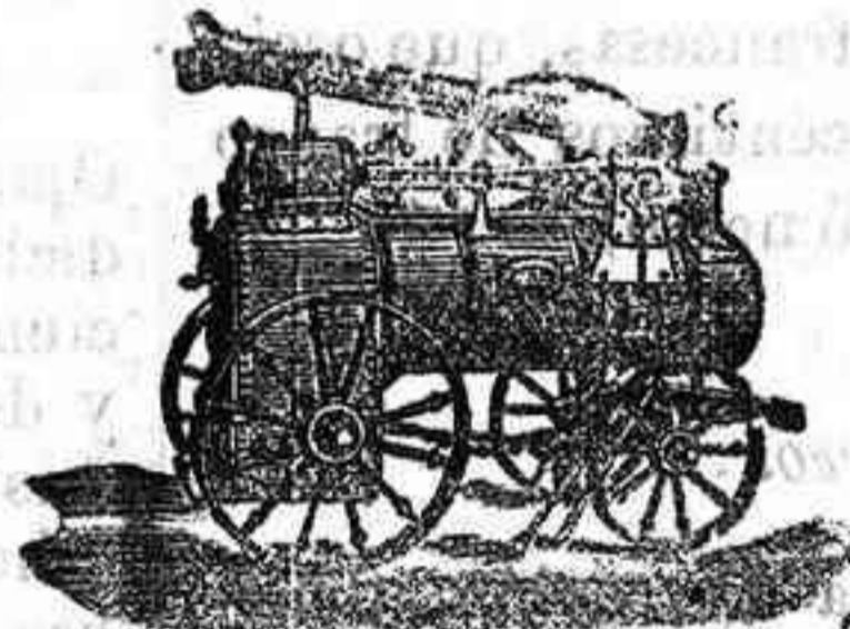
Máquina de vapor locomovil

Máquinas de vapor. — Bombas. — Pesas. — Tubos de todas clases. — Aparatos para hacer gaseosas y toda clase de máquinas.