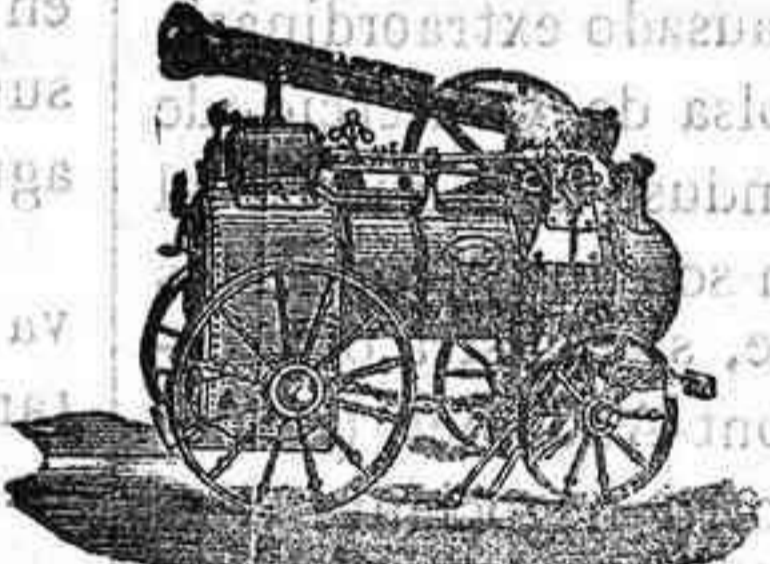
Máquina de vapor locomovil