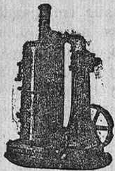
MADUINA DE VAPOR VERTICAL.

Catálogos gratis y franco á quien los pida.