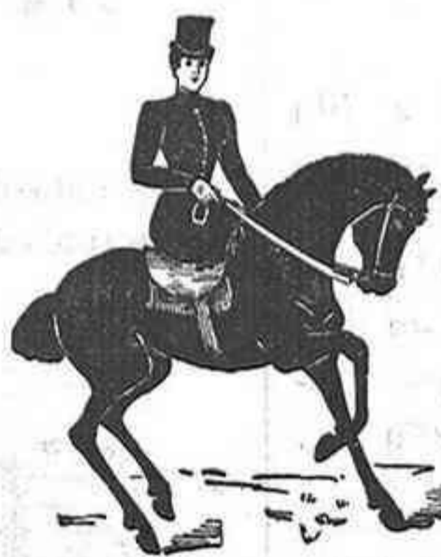
No confundirse: junto al Cuartel del Conde.