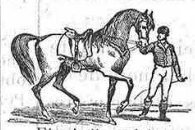
El caballo andaluz

Infinidad de caramelos.—Preciosas cajas para regalos.—Pasteles variados todos los días.—Riquisimas tartas.—Variados platos de postres.