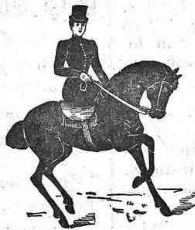
No confundirse: junto al Cuartel del Conde.