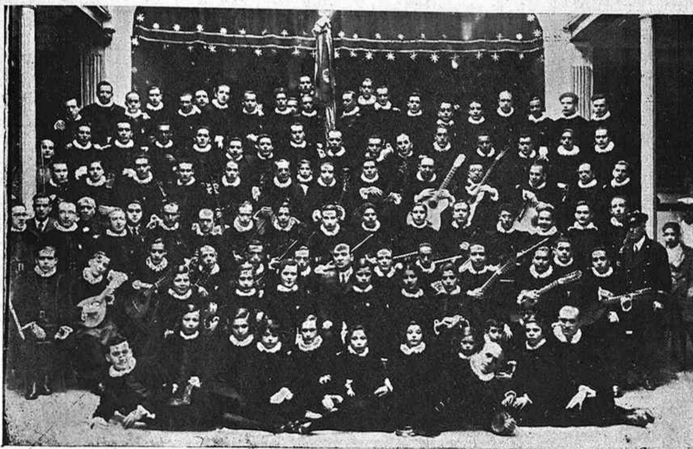
Ultima fotografia del cuadro artístico del Centro Filarmónico «Eduardo Lucena», obtenida el día 1.º del mes actual de Marzo en el domicilio social de esta veterana agrupación musical cordobesa.