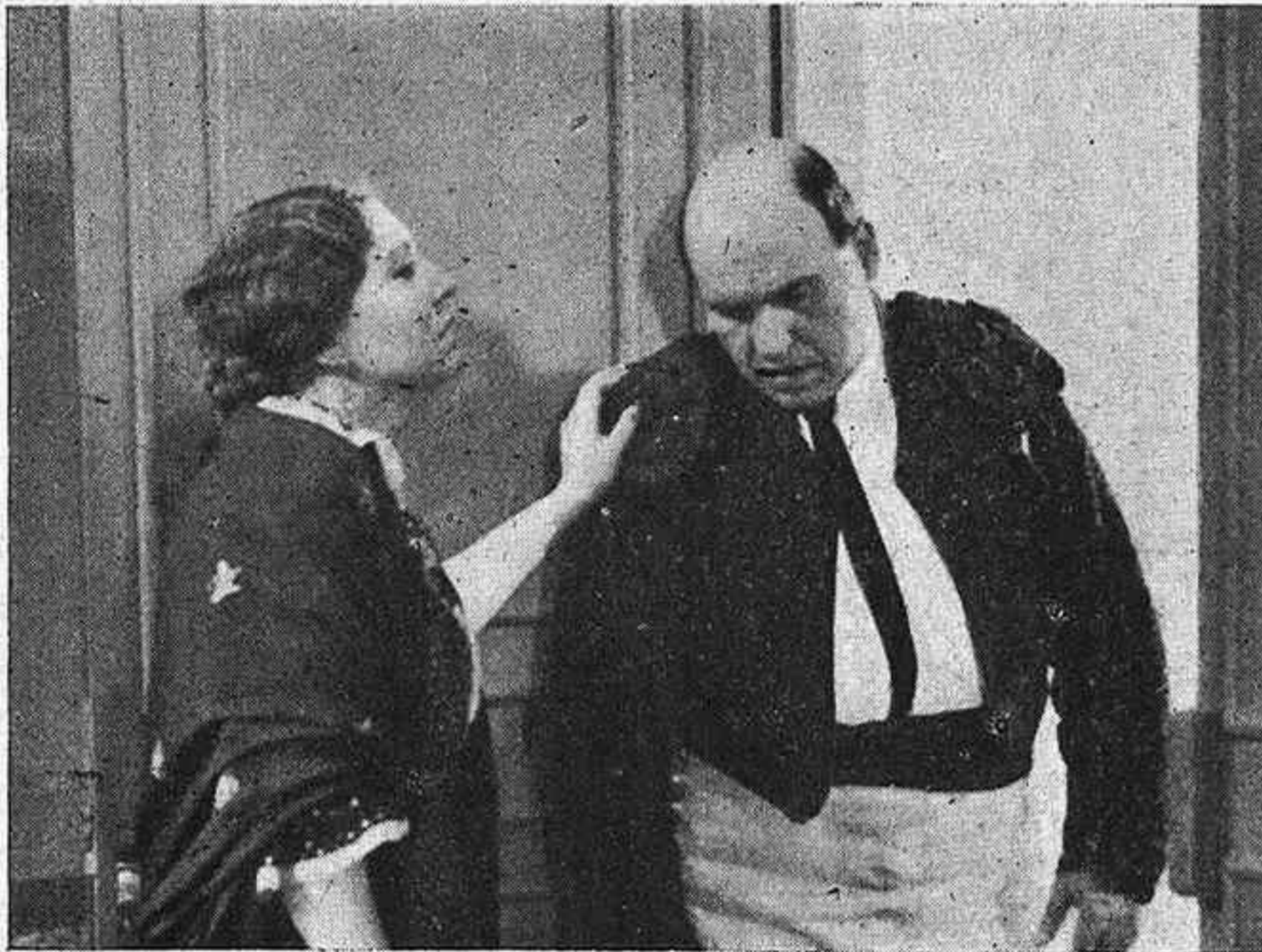
Otro plano de EL GATO MONTÉS, la popular ópera de Penella que próximamente será presentada por Cifesa.

No cabe más, en fin, y seguros estamos de que el público unirá sus elogios a los nuestros que, por adelantado y espontáneamente, dedicamos a la producción sonora EL GATO MONTES, que