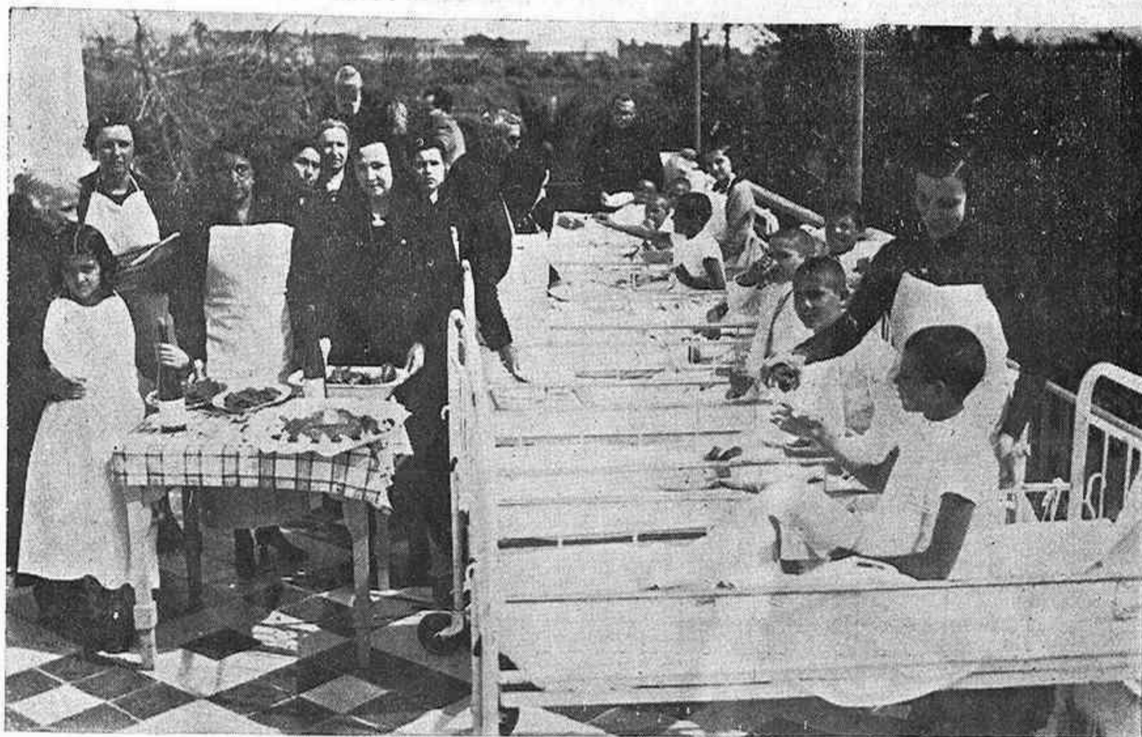
Comida extraordinaria servida por distinguidas damas cordobesas a los niños acogidos en el Hogar y Clínica de San Rafael.