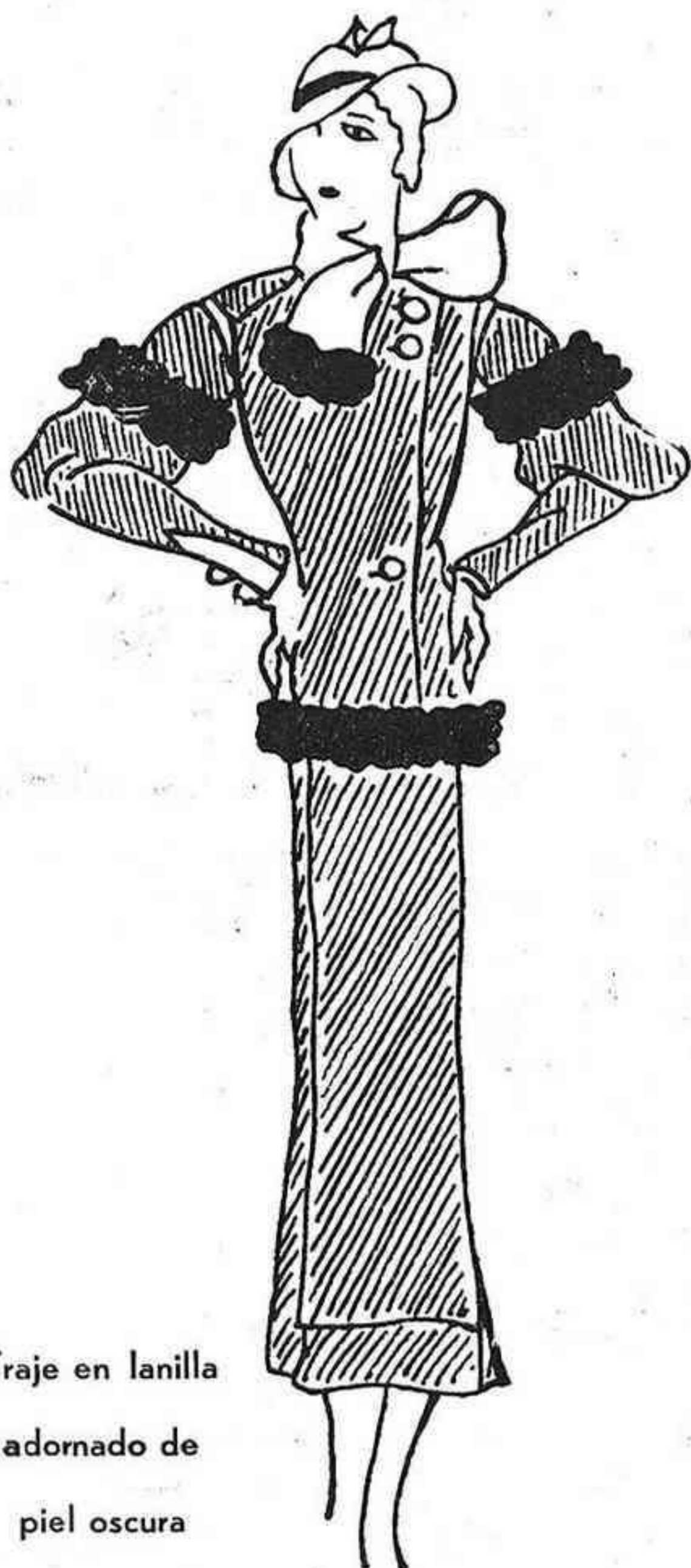
Traje en lanilla adornado de piel oscura

Da comienzo la exhibición de los trajes "tailleurs" y deporte. ¿Qué podemos decir de ellos?