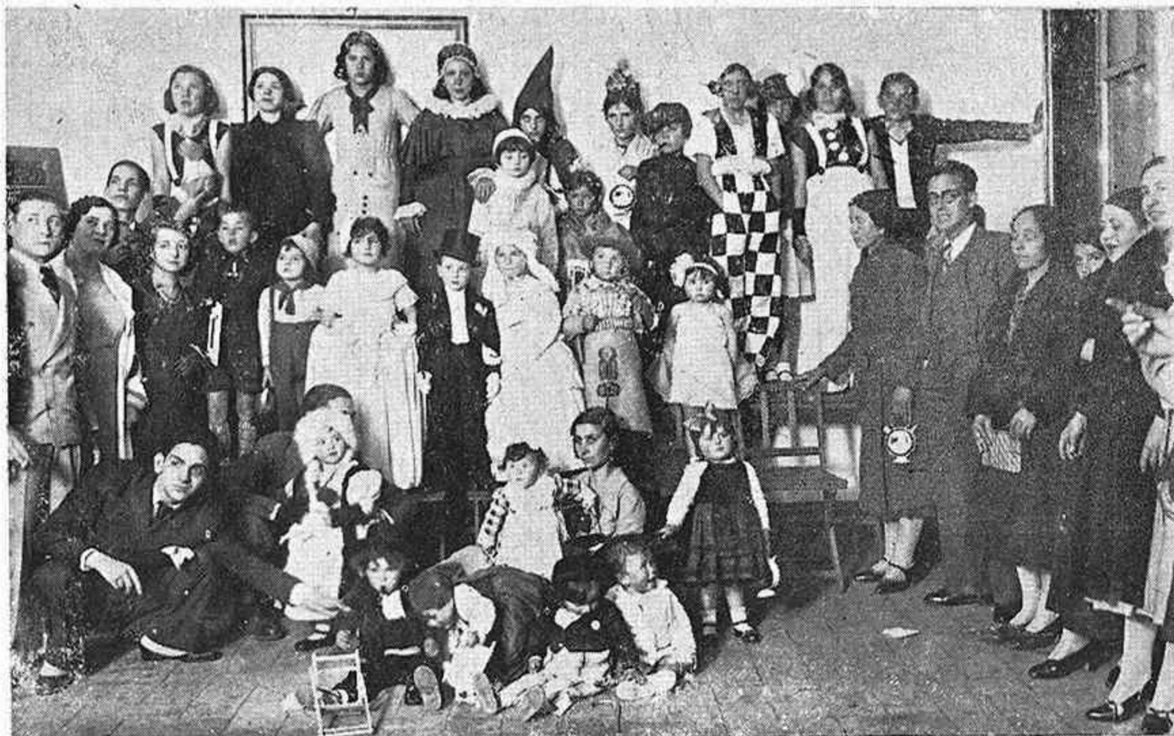
EN EL CENTRO FILARMÓNICO "EDUARDO LUCENA". - Algunos de los niños y niñas que concurrieron al baile infantil celebrado por esta agrupación musical en su domicilio social