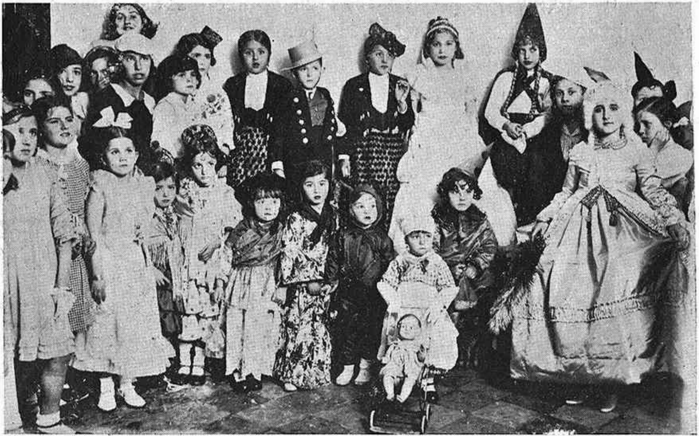
EN EL CÍRCULO DE LA AMISTAD. – Niños y niñas caprichosamente vestidos, que asistieron al baile infantil celebrado en este aristocrático Círculo, el día 12 del actual.