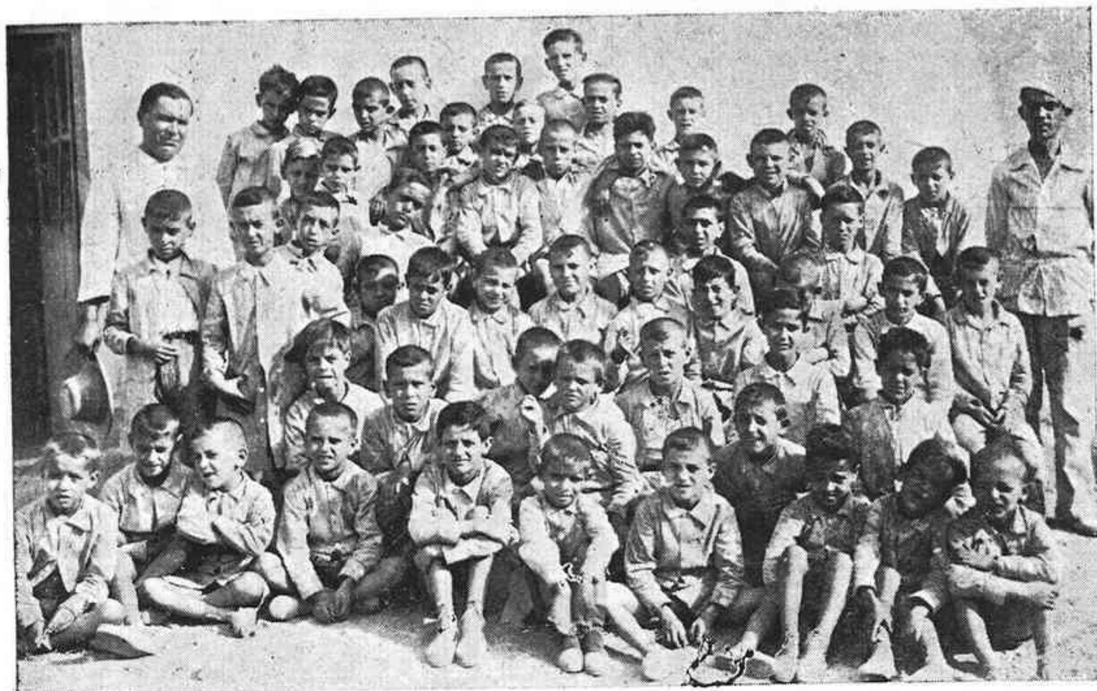
Niños de las escuelas públicas de Málaga que veranean en las alturas de Cerro Muriano.