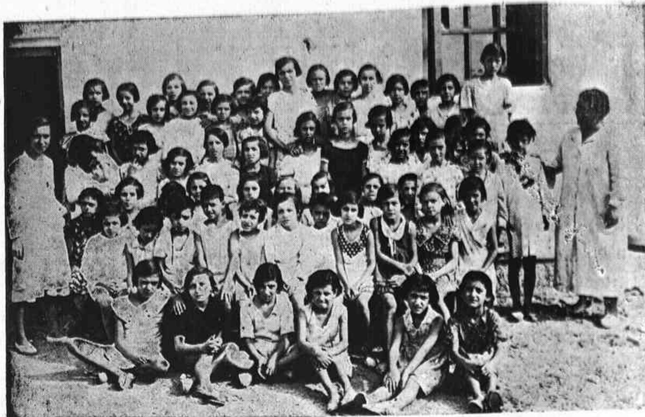
Grupo de niñas que componen la colonia escolar malagueña que pasan temporada en Cerro Muriano.