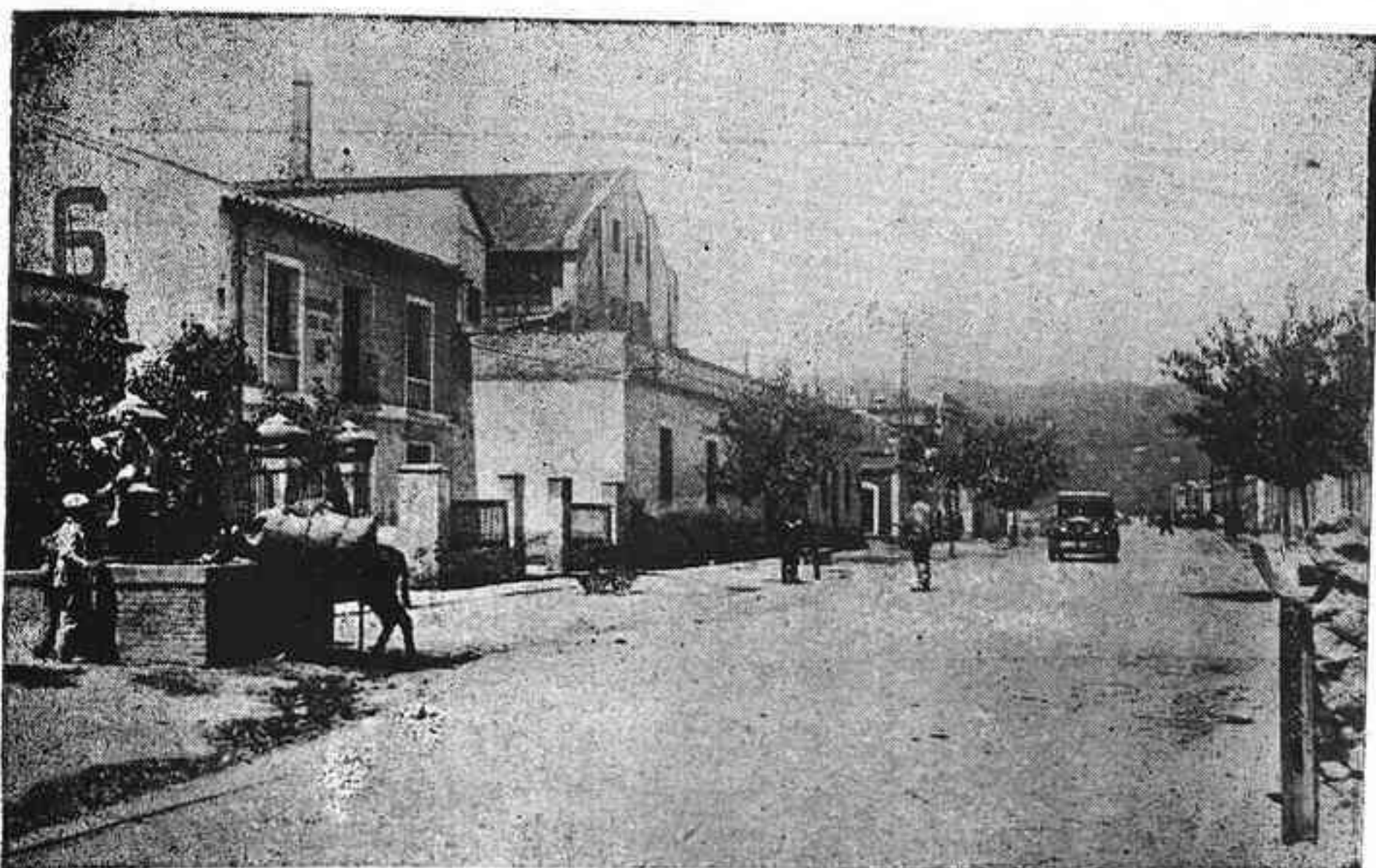
La mole gigantesca de la Sierra sirve de fondo a esta perspectiva de Las Margaritas

«Barrio de las Margaritas barrio alegre cordobés, que estás aislado del mundo por dos pasos a nivel».