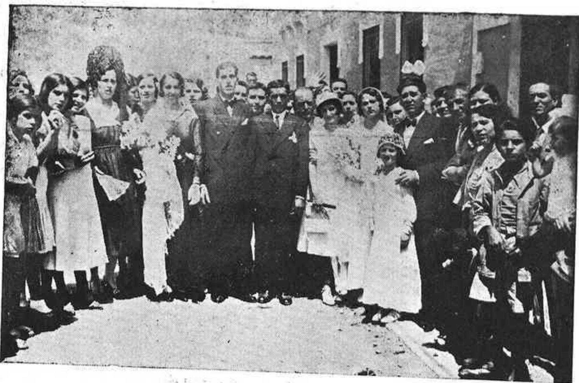
El fotógrafo ha sorprendido a los asistentes a dos bodas celebradas en la popular barriada.

Noche caliginosa del estío cordobés. Calor de horno en la ciudad. La gente huye del ambiente angustioso de las viviendas e invade las plazas y paseos o animan las puertas en pintorescos grupos.