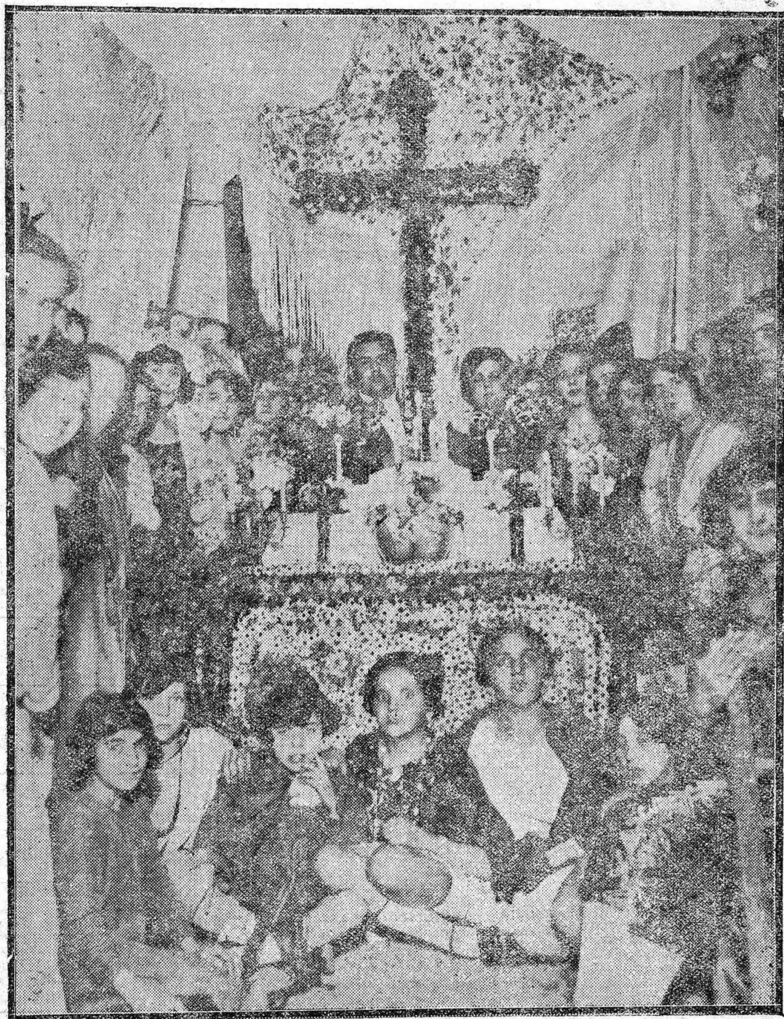
LAS CRUCES DE MAYO.---Artística Cruz Instalada en el número 2 de la plaza de San Pedro.