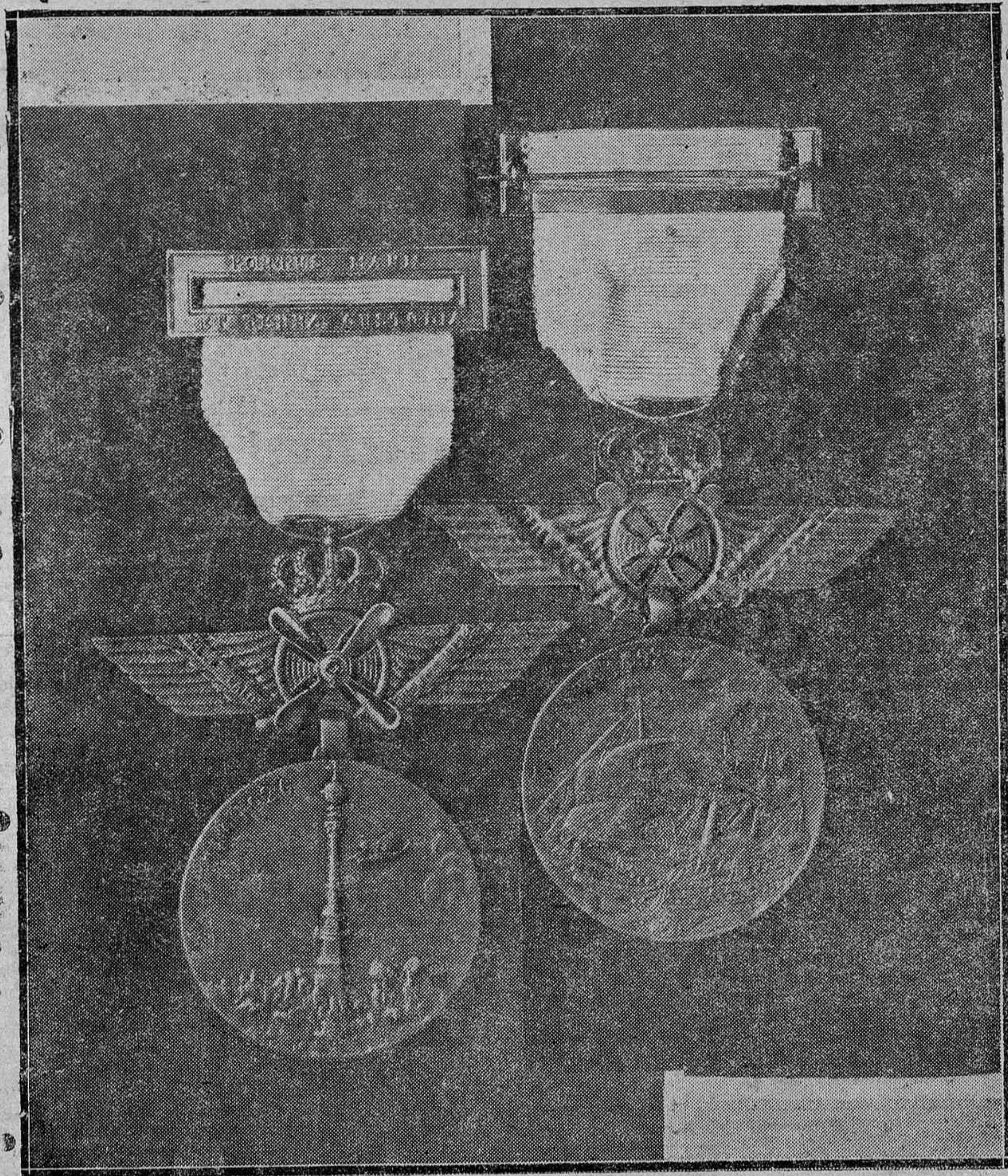
Anverso y reverso de la medalla conmemorativa del vuelo Palos-Buenos Aires, que la ciudad de Huelva regala a los aviadores.