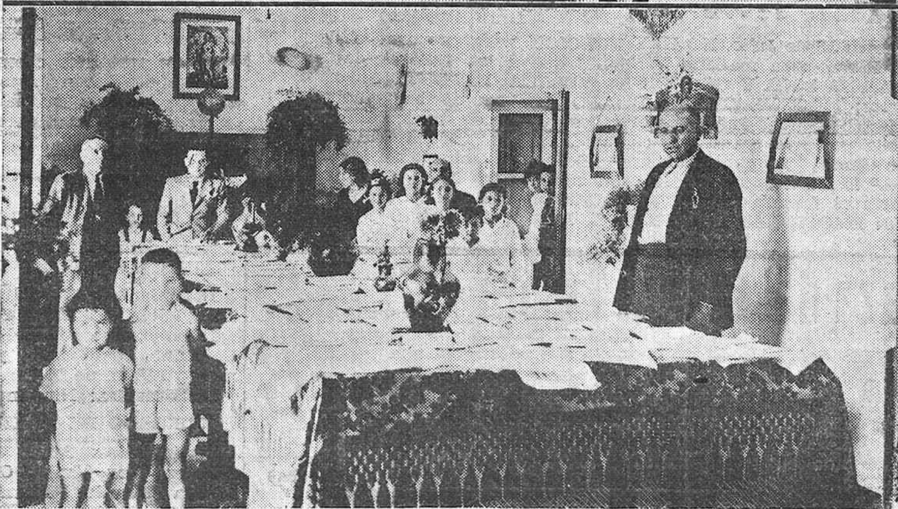
Das visitas de la magnífica Exposición escolar organizada en el Grupo Escolar "Lucano", y cuyos trabajos han sido admirados por innumerables personas que han desfilado por la mencionada Exposición.