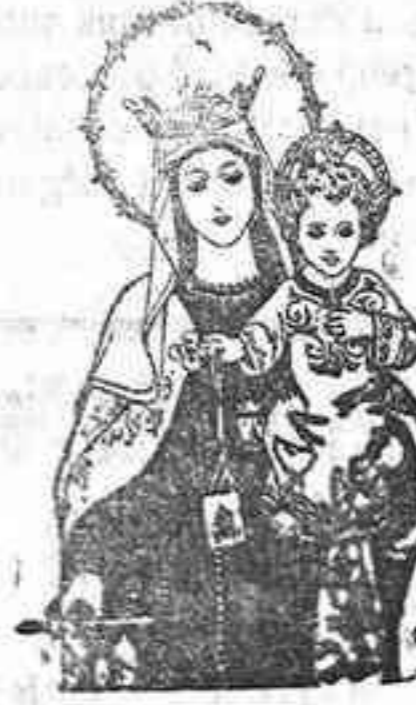
Imágenes y Vitrinas de las mejores clases de Olot

Autorizar al señor Presidente para que determine la forma de contribuir a los actos que la Real Academia de Ciencias Bellas Letras y Nobles Artes ha de celebrar con motivo del primer milenario del Califato Cordobés.