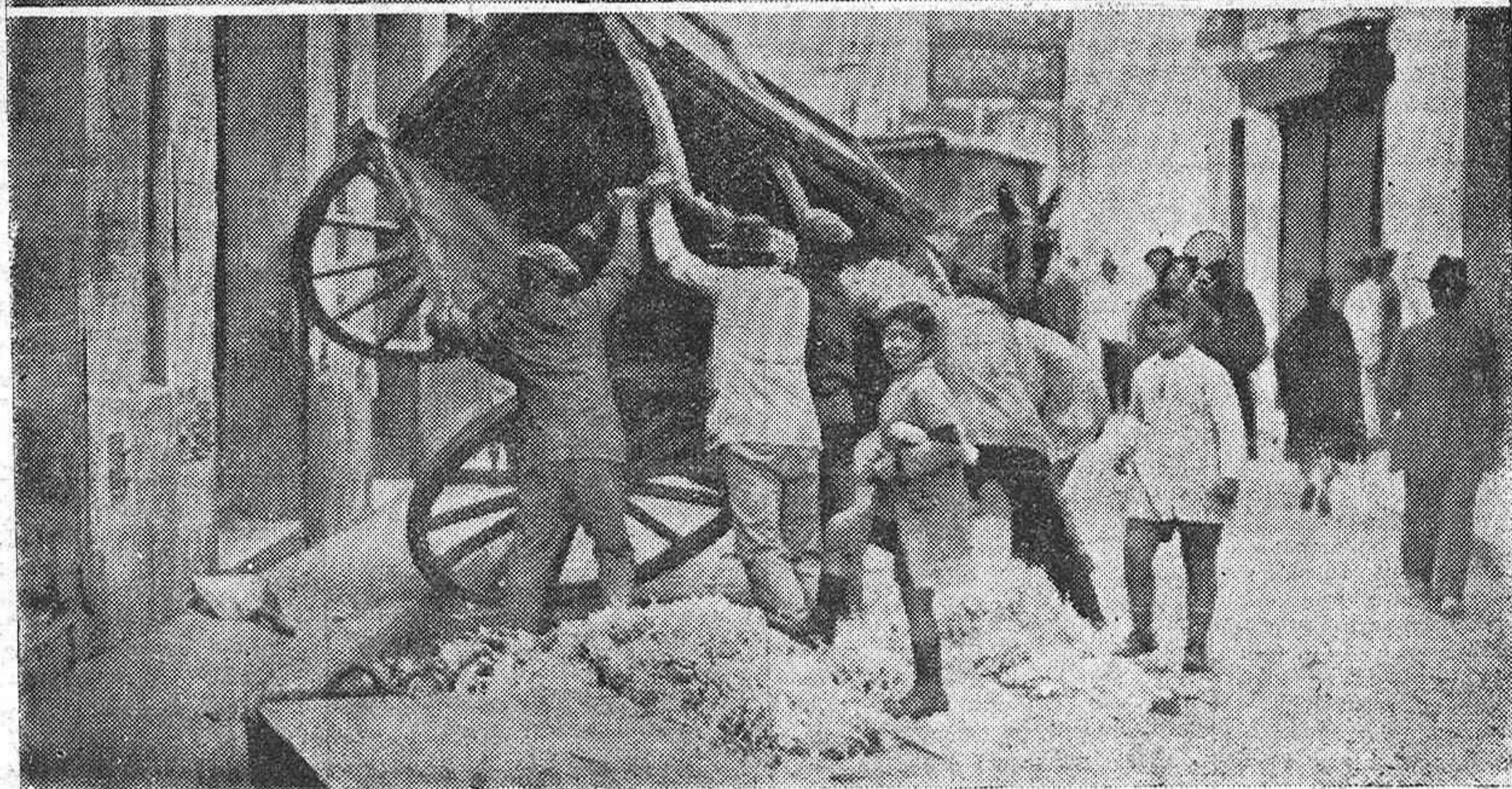
LA HUELGA DE SEVILLA.—FUERZAS DE SEGURIDAD PROTEGIENDO UN AUTO, VOLCADO POR LOS HUELGUISTAS.—EN LA PLAZA DE LA ENCARNACIÓN, LOS REVOLTOSOS VOLCANDO UN CARRO, CUYO CONDUCTOR RESULTÓ HERIDO