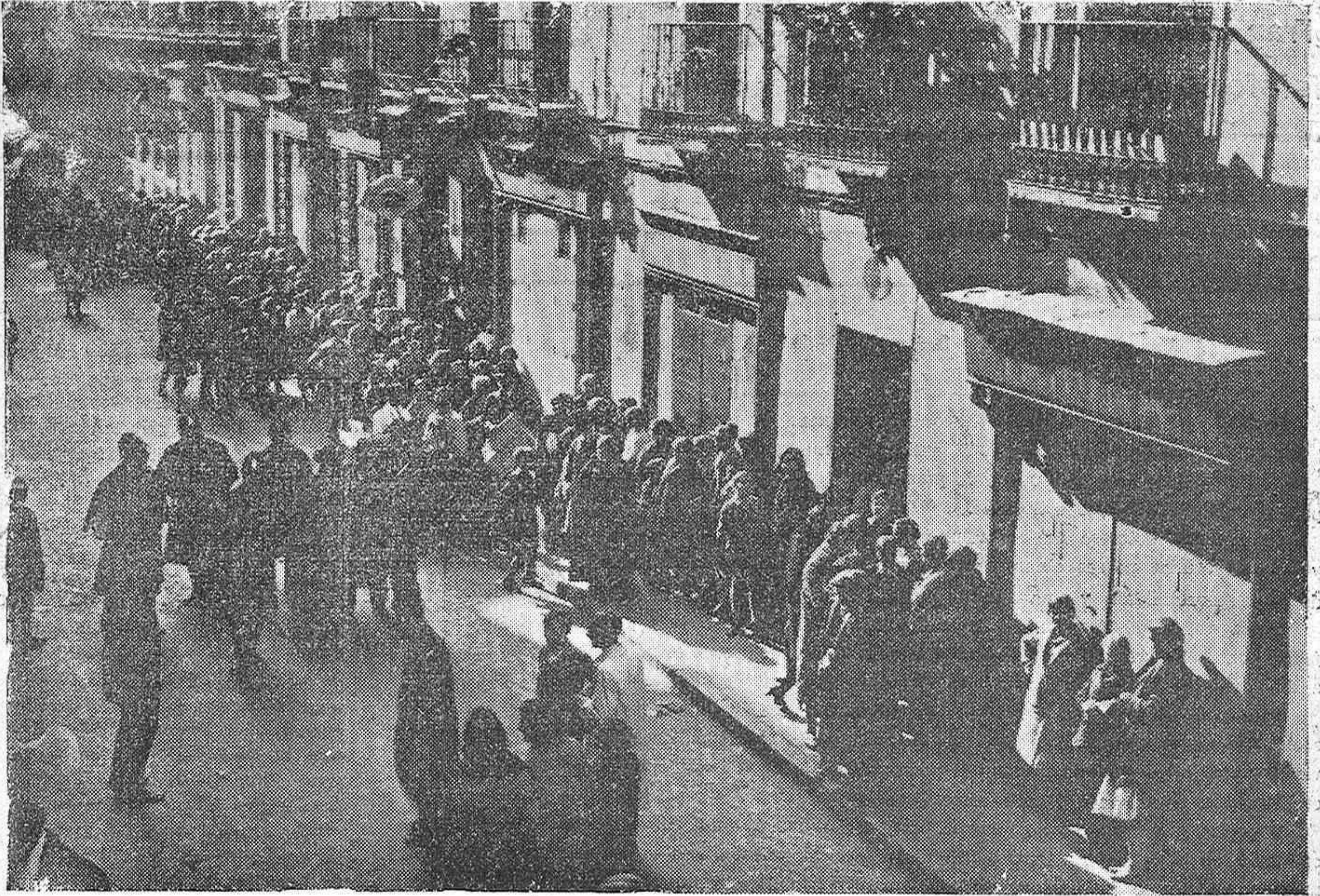
MADRID.—LA HUELGA GENERAL.—LA «COLA» EN LAS PUERTAS DE LAS PANADERÍAS ESPERANDO PROVEERSE DE PAN