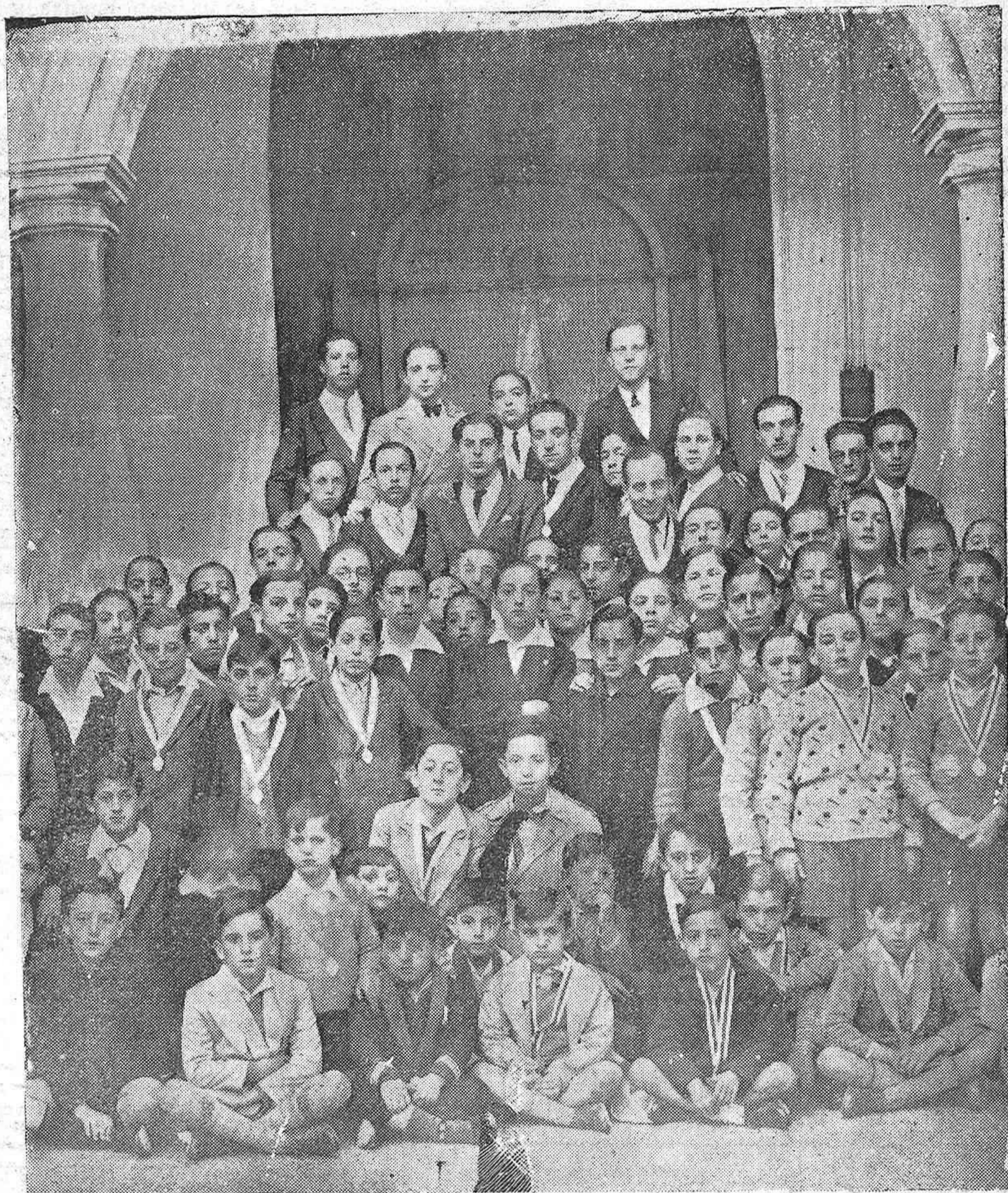
EN LA REAL COLEGIATA DE SAN HILITO. — IMPOSICIÓN DE LAS MEDALLAS A LOS JÓVENES QUE ACABAN DE INGRESAR EN LA CONGREGACIÓN DE SAN ESTANISLAO DE KOSTKA