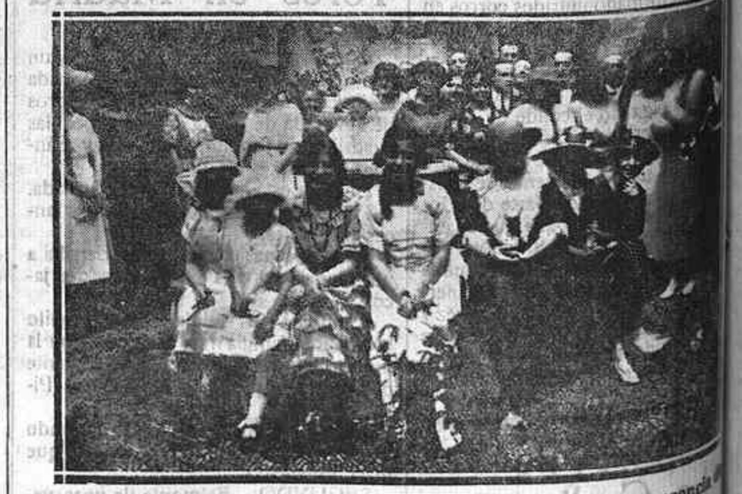
Grupo de bellísimas señoritas de la aristocracia que con su presencia dieron esplendor y alegría a la ceremonia nupcial