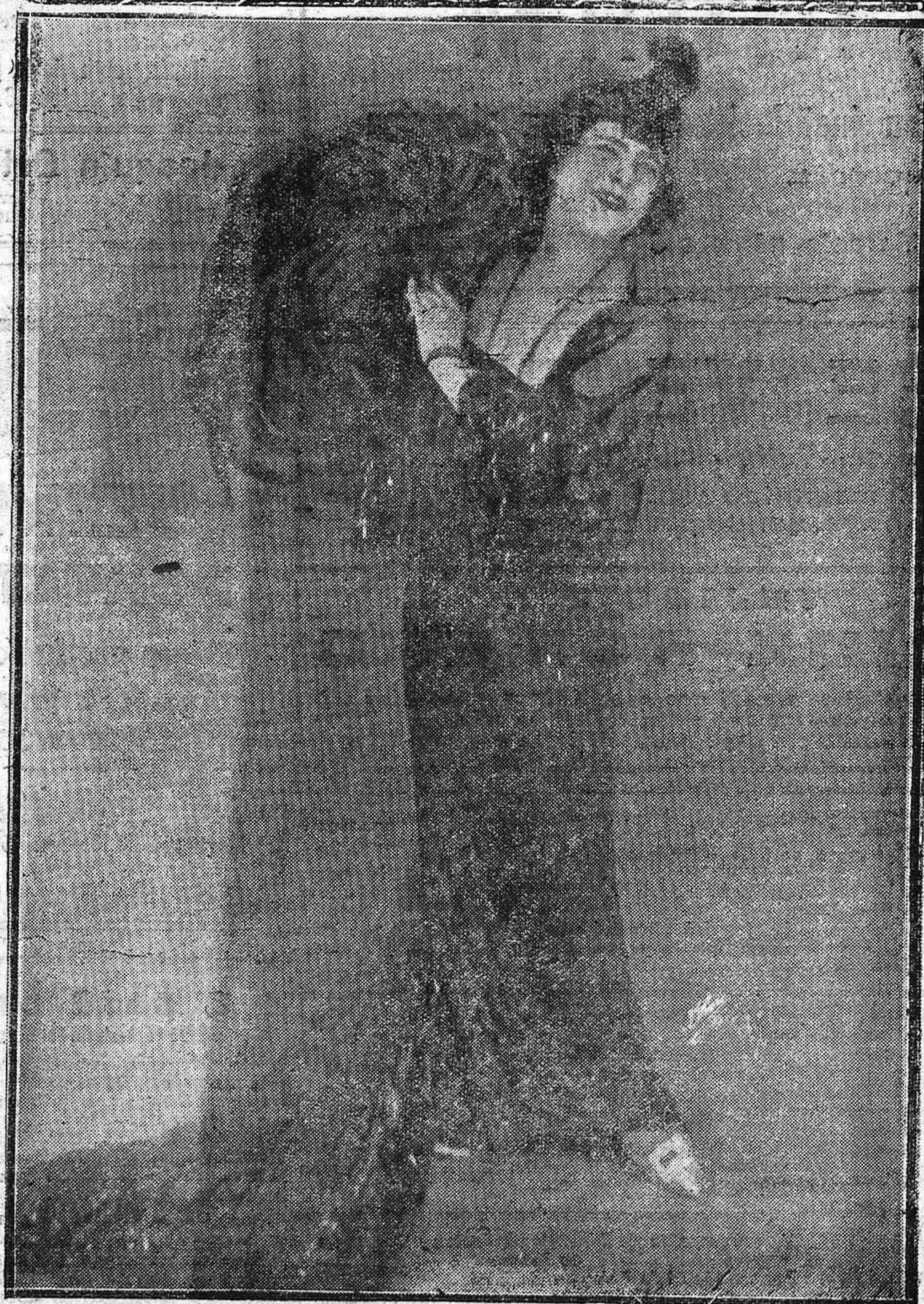
Mimi Agúgila, la famosa actriz universal, acerca de cuya modalidad española ha dado una conferencia esta tarde en el Círculo de la Amistad el escritor Rivas Cherif.