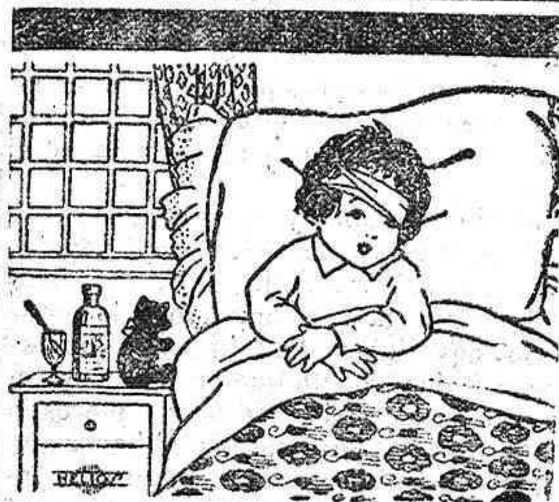
Manolito está en cama. ¿Qué tendrá Manolito?