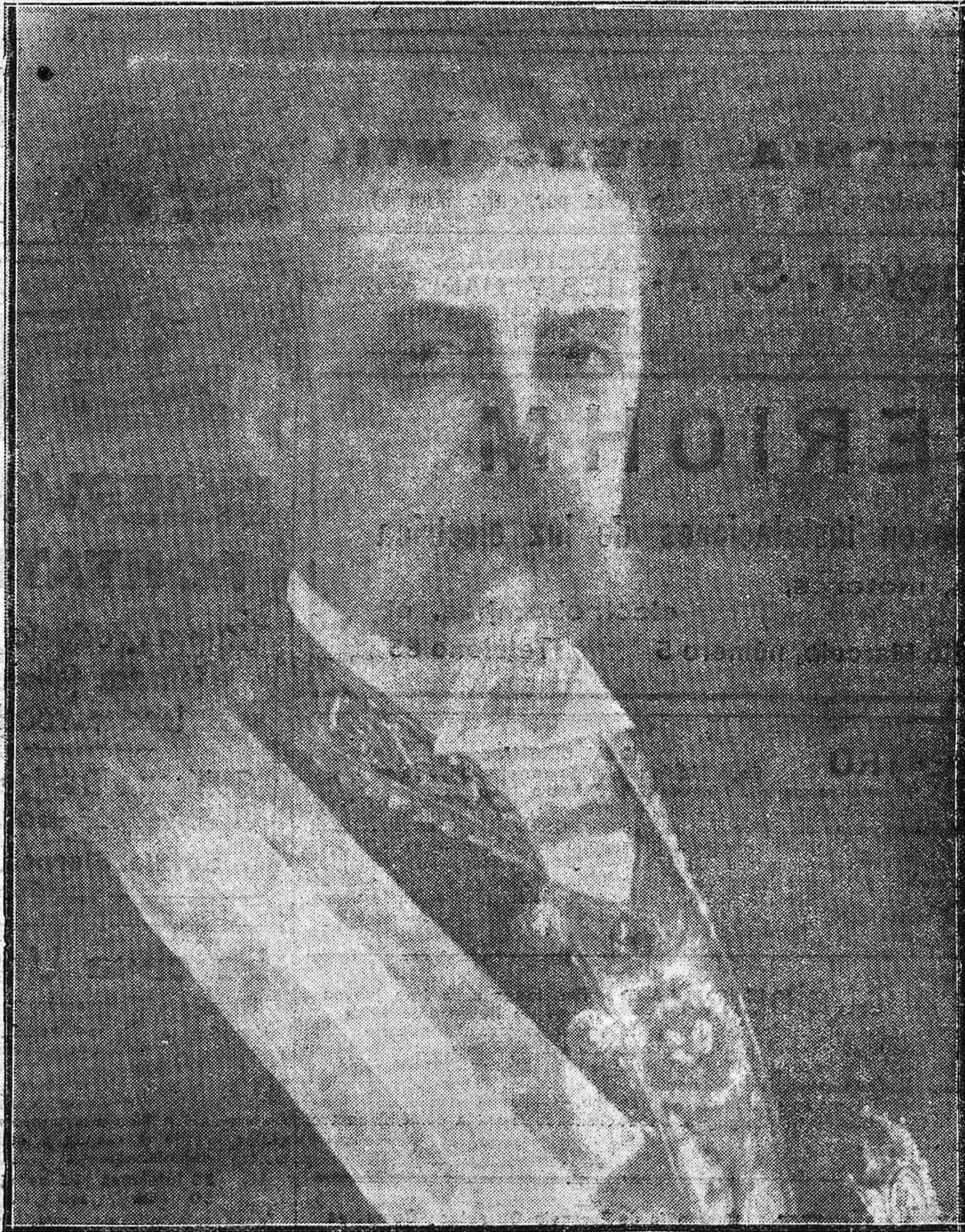
EL CONDE DE TORRES GABRERA, ILUSTRE PATRICIO CORDOBES. ---Retrato al óleo donado al Ayuntamiento recientemente por el Cronista de la Ciudad, para que sea colocado en el Salón Capitular.