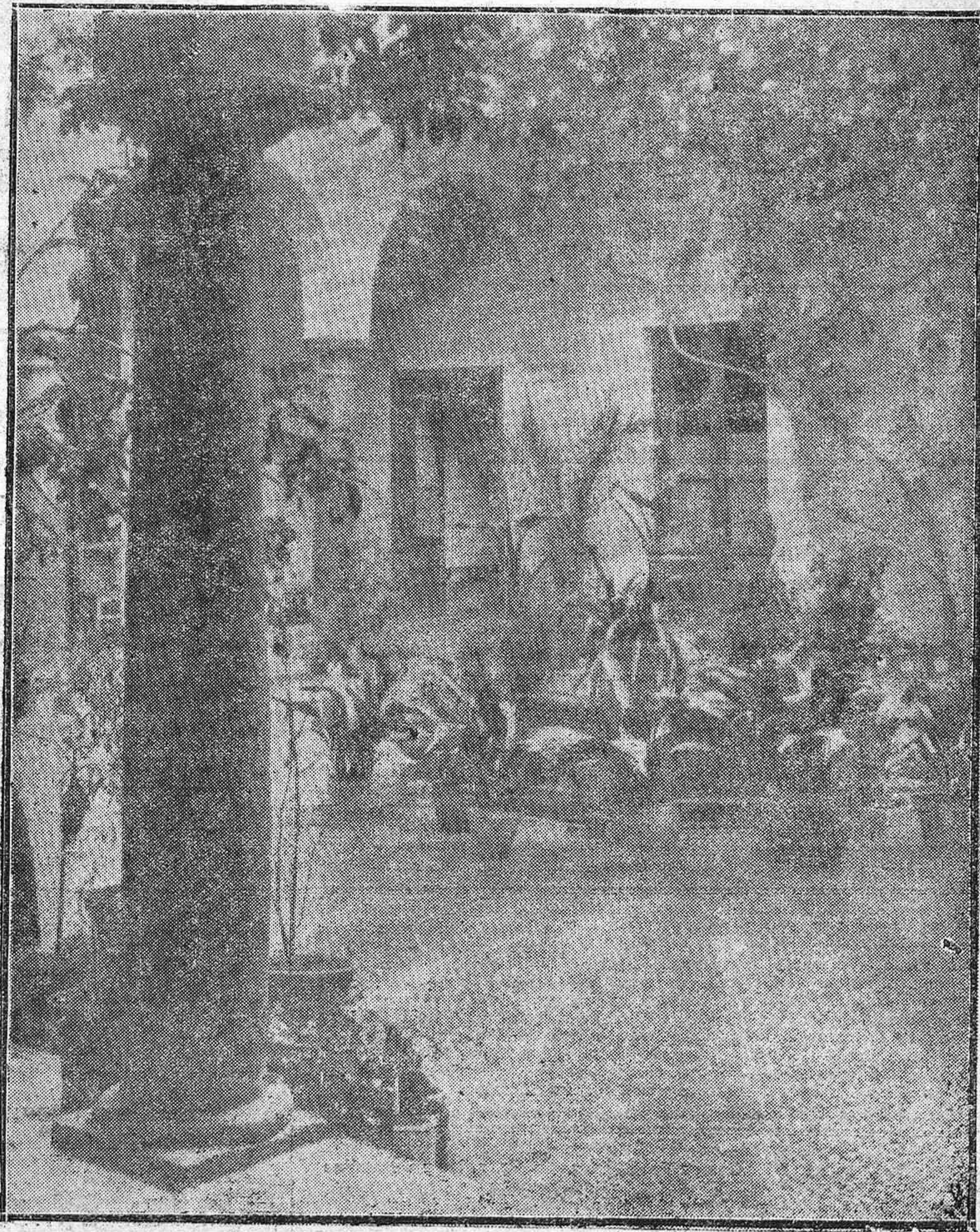
EL INTERNADO TERESIANO.--Bonito patio de la gran Institución domiciliada en la Plaza de la Concha.