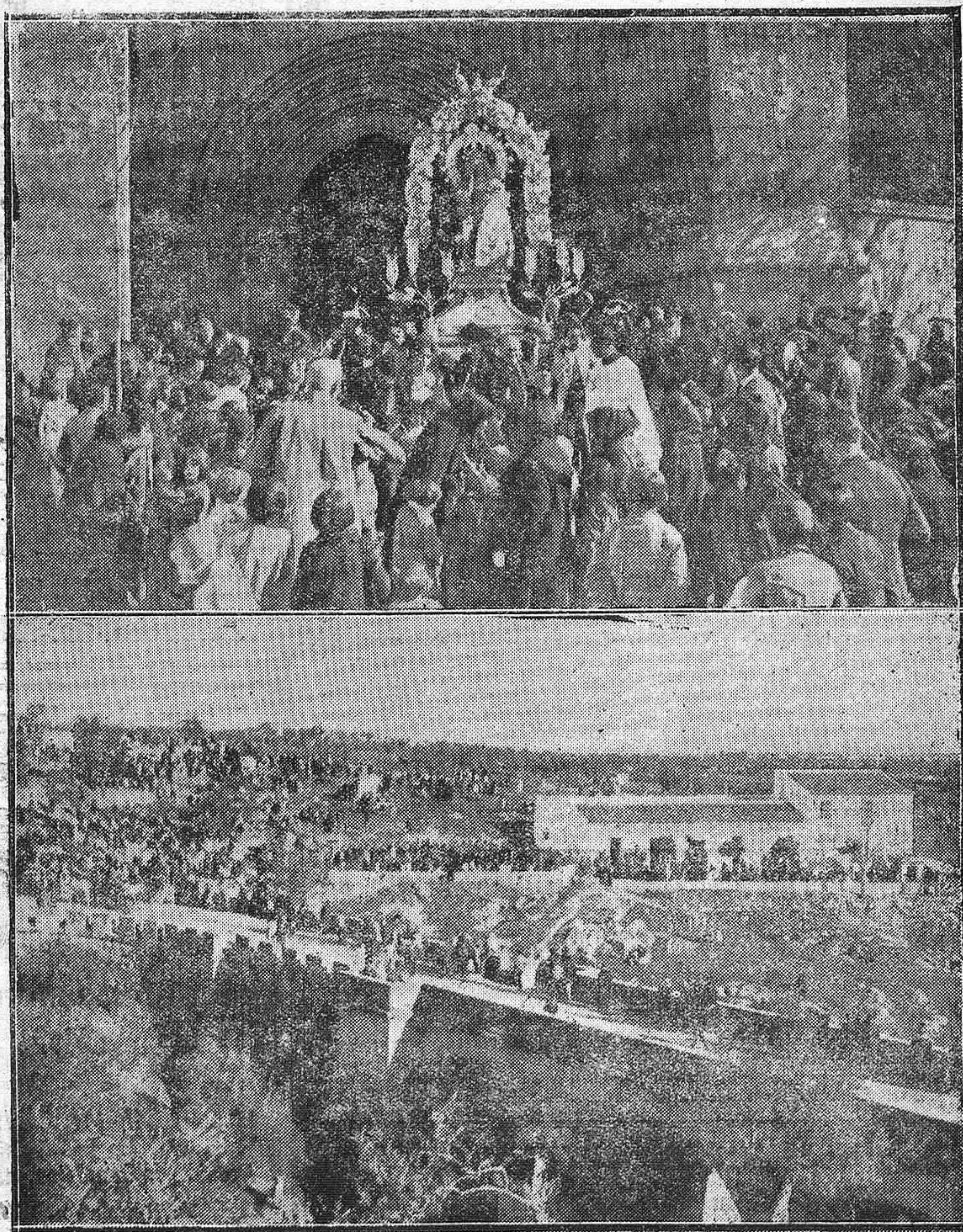
1) La procesión de la Candelaria, saliendo de Santa Marina.--2) Aspecto del Arroyo de Pedroches durante la típica romería de la Candelaria.