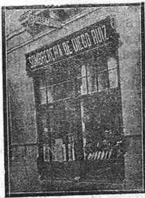
CALLE DE MARÍA CRISTINA - CORDOBA

Lanzada está la idea, las señoras tienen la palabra y nuestro modesto concurso no había de faltarles en pró de la moral en el teatro.