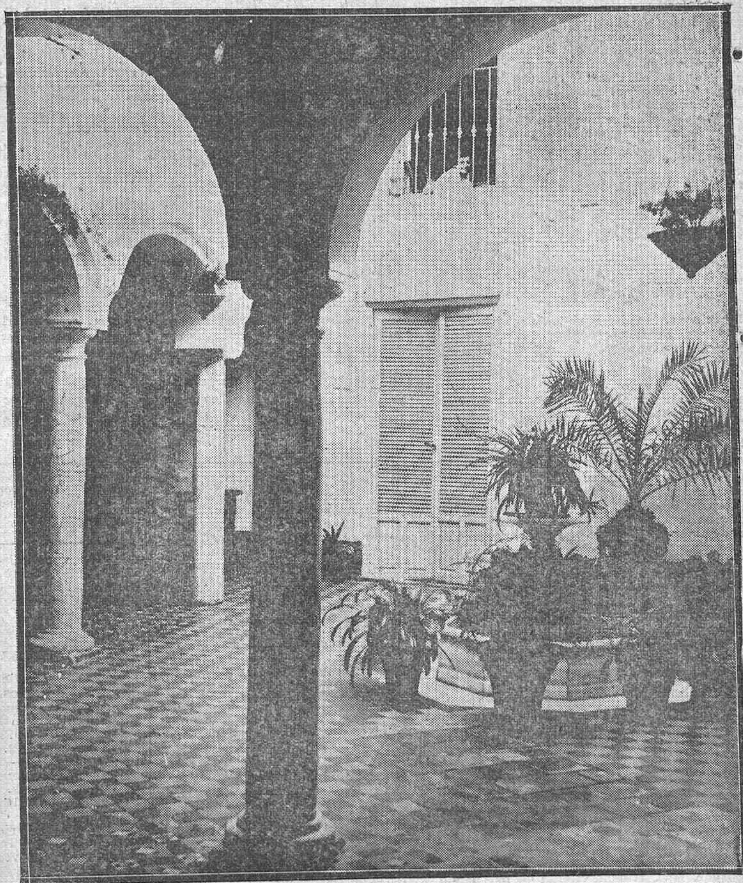
GALERÍA DE PATIOS CORDOBESES.—Típico patio de la casa número 4 de la calle Pedro López.