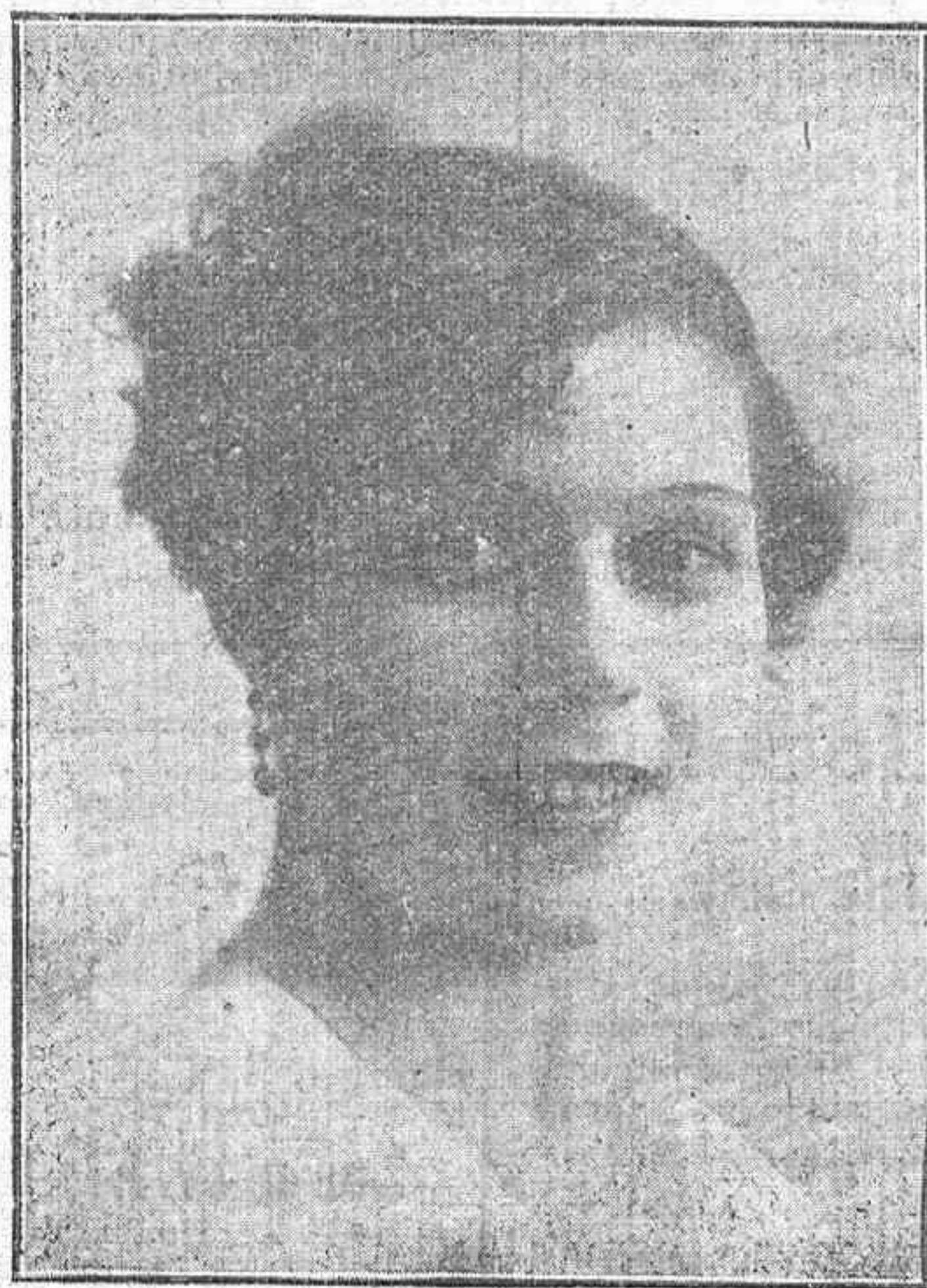
PRIMERA ACTRIZ DE LA COMPAÑÍA ENGUIDANOS, QUE AYER CELEBRÓ SU BENEFICIO