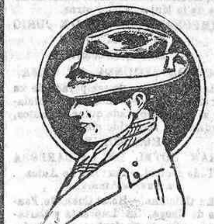
La gorra DIEGO RUIZ es la marca de Lulo, adoptada por todos los Elegantes.

Co'abramos publicar estas noticias y celebraremos más poder decir bien