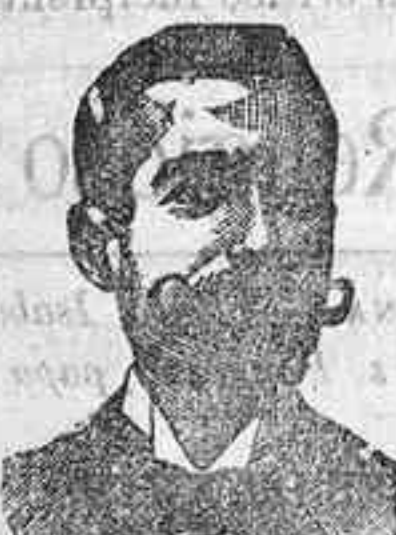
Inventor de los renombrados medicamentos COSTANZI

Form: con; trem; spec; inye; fog; mr; e. z. roob; qui; cal; dal; leg; cas; sal; par; zuc.—