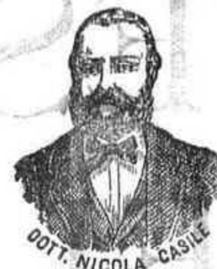
Inventor de los renombrados medicamentos