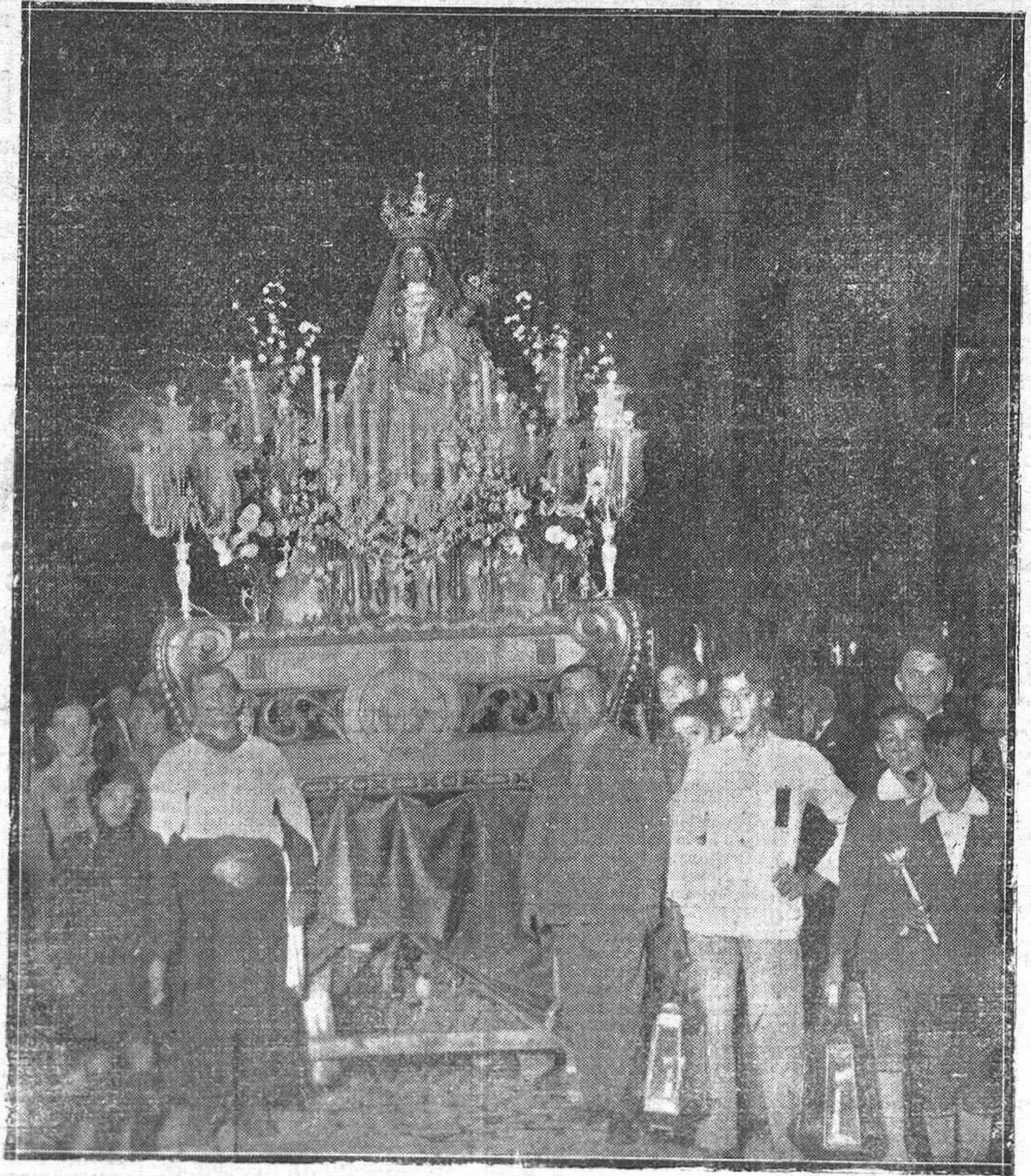
LA PROCESION DE ANOCHE. — LA VIRGEN DEL SOCORRO RECORRIENDO PROCESIONALMENTE LAS CALLES DE LA CIUDAD