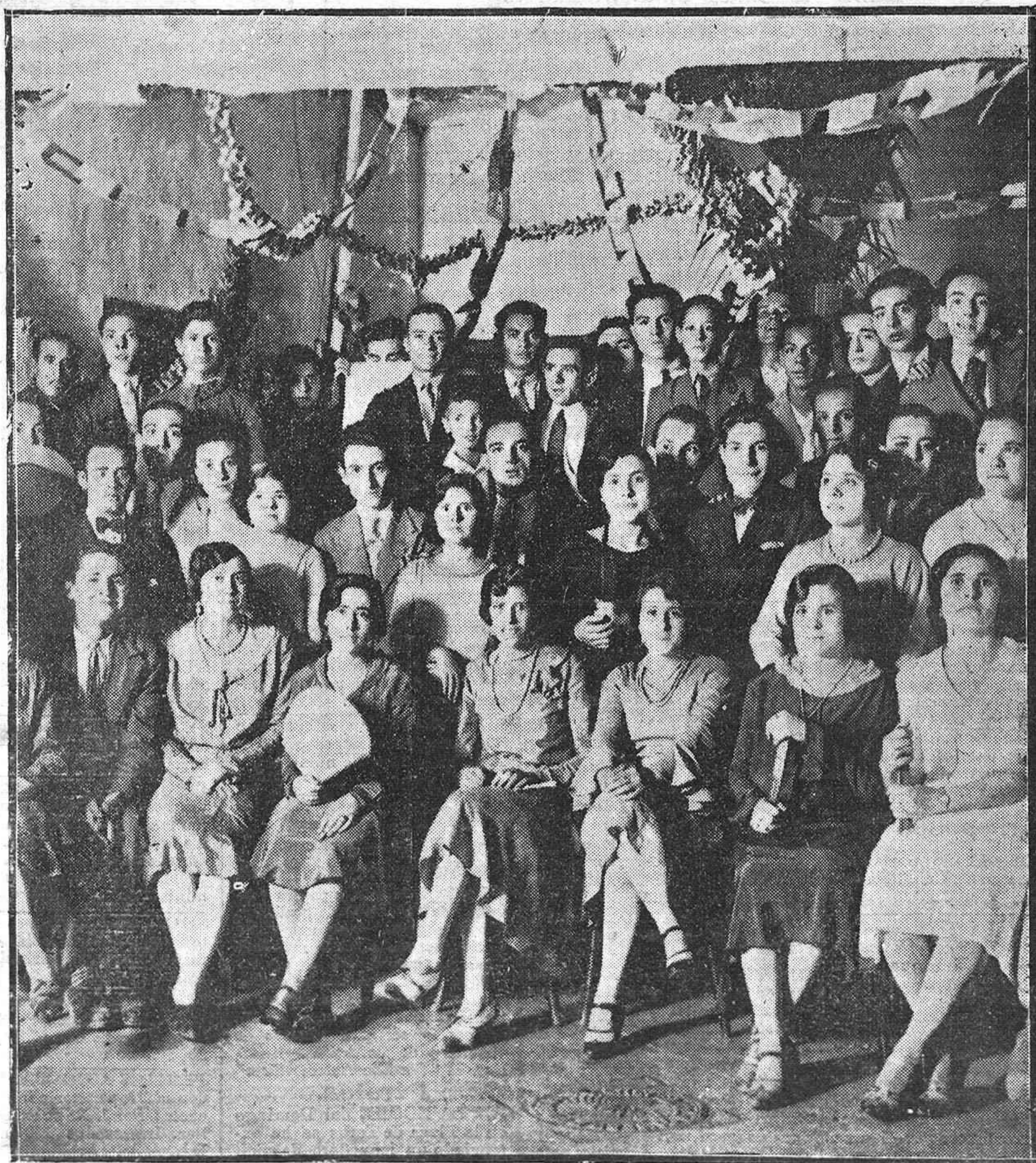
NUEVA SOCIEDAD DEPORTIVA RECREATIVA.—DISTINGUIDOS JÓVENES QUE ASISTIERON A LA INAUGURACIÓN DE LA NUEVA AGRUPACIÓN «SAN NICOLÁS F. U.», DONDE SE CELEBRÓ UNA ANIMADA VERBENA