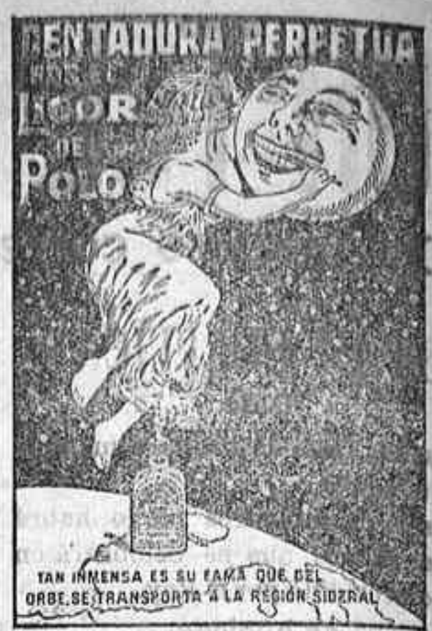
TAN INGENUO ES SU FAMA QUE DEL ORBE SE TRANSPORTA A LA REGIÓN LOCAL

Envíenos los oros de la real cédula de venta, remitiendo por 60 en cinco pesetas, libranza o billete, a Nuestra Administración