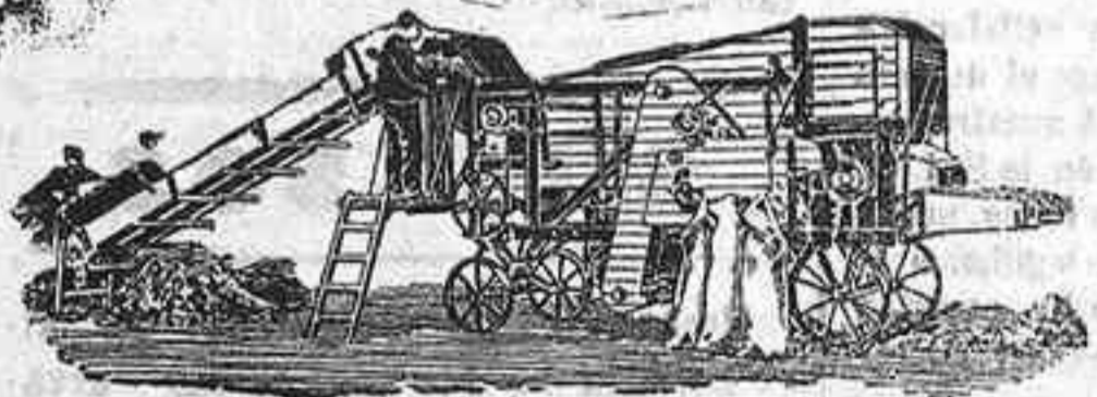
Trilladora Triunfo chica