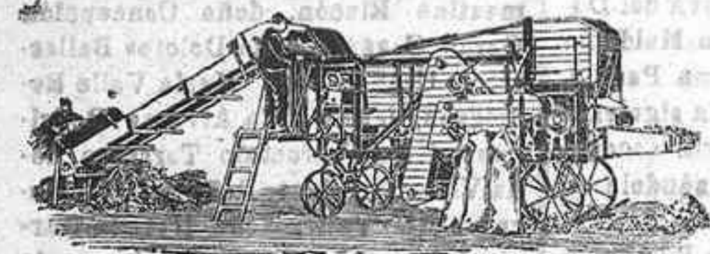
Trilladora Triunfo chica