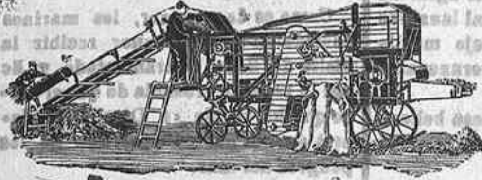
Trilladora Triunfo chica

Para labores grandes: Trilladoras Lanz de 4½ y 5 pies de ancho con locomóviles de igual marca. Rendimiento diario de 42 á 46 y de 50 á 55 carretadas.