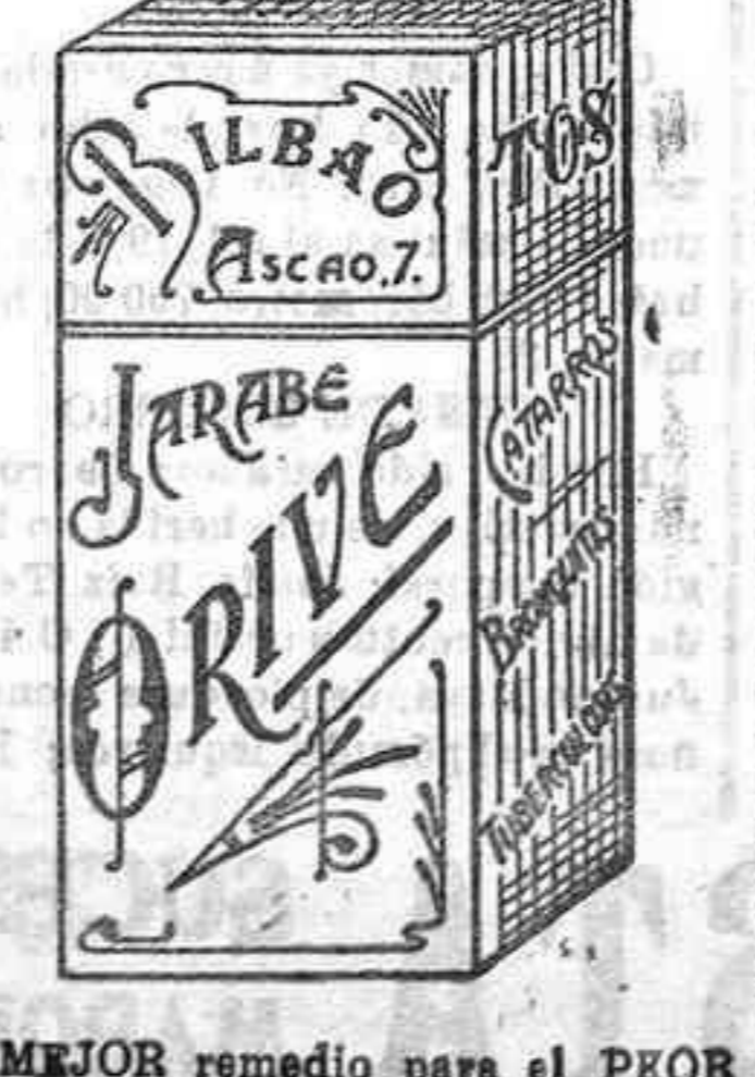
El MEJOR remedio para el PROR catarro, Jarabe Orive.

De Fuente Ovejuna NOVENA A LA INMACULADA El pasado día 15 terminó en nuestra iglesia parroquial la solemnidad de la Inmaculada Concepción. Cantó desde la sagrada cátedra las glorias de María, el R. P. Nicomedes Llerena, del Corazón de María, de la residencia de Córdoba. Las hermanas pontificas predicaron: hacer el resumen de los sermones; el así no fuera, el correspondiente cetera algunas de sus más brillantes párrafos que el citado padre, durante las nueve noches, desarrolló de un modo magistral. Resulta muy felicitación. En el altar mayor y circundada de bombillas eléctricas, apareció la figura excelso de María Inmaculada, á quien el coro filarmónico le dirigía hermosos cánticos y á lo que todos los fieles imploraban piedad en sus miradas. La iglesia estuvo toda la noche, en donde pudimos admirar unos hermosos confesarios que nuestro Arcobispo ha traído de Córdoba y otras mejoras dignas de alabar y que hacen hara-