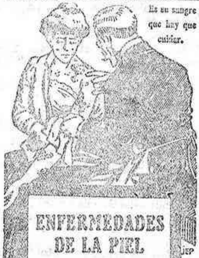
Es su sangre que hay que cuidar.

Informa Antonio Conrotto y Barbero. Oficinas de la Compañía de Seguros «La Estrella», Plaza del Angel, núm. 8. (San Hipólito). Córdoba.